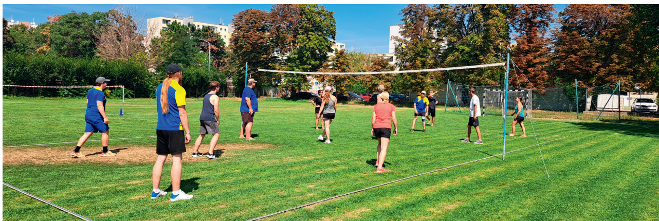
Team D gegen Team C im Volleyball