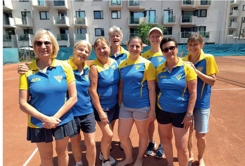
Gruppenfoto Damen Grenzlandmannschaft