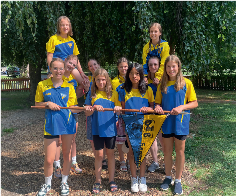
Unser Team am Bundesjugendturnfest