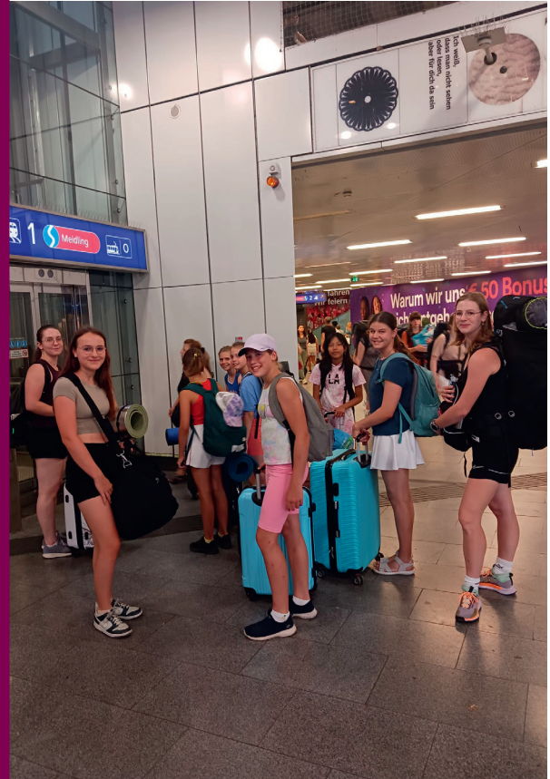
Auf dem Weg zum Bundesjugendturnfest