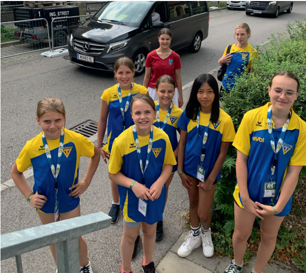
Unser Team am Bundesjugendturnfest