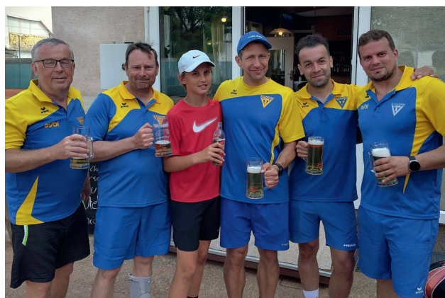
Gruppenfoto Herren Grenzlandmannschaft