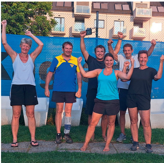
Team C als Sieger beim Mannschaftswettkampf

Das eigentlich geplante Pausenspiel mit den Laufstelzen musste leider kurzfristig abgesagt werden. Dieses wäre wohl zu anstrengend gewesen (für die Laufstelzen). So wurde kurzerhand die wahrscheinlich liebste Sportart, das Würfeln, als Pausenspiel verwendet.